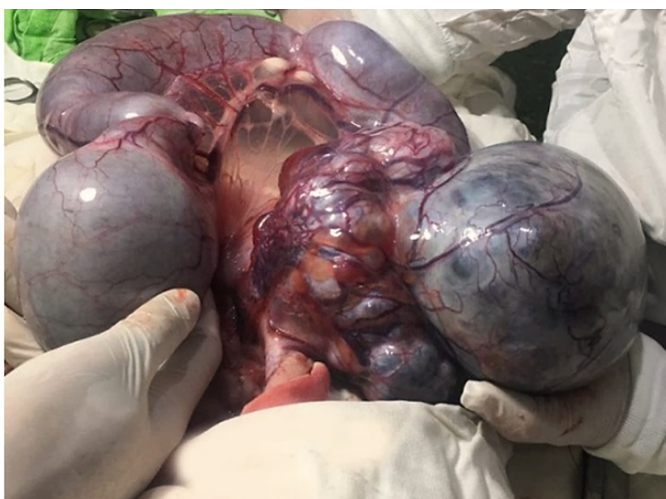
Figura 1. Se aprecia útero con piometra de gran tamaño

Hallazgos anatómicos compatibles con piometra en un canino macho que presenta criptorquidia bilateral, dentro de su abdomen órganos reproductivos de una hembra, compatible con pseudohermafroditismo y tumor de células de Sertoli. No se realizaron estudios genéticos debido a dificultades durante la pandemia.