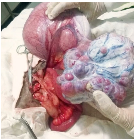
Figura 2. Se aprecia la gónada del cuerno uterino izquierdo aumentada de tamaño con una estructura similar a un complejo tumoral de células de Sertoli, en la parte posterior se observa una estructura compatible con una trompa de falopio