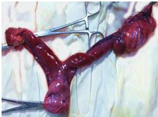
Figura 4. Útero con colecta leve, se observa ovario derecho de apariencia normal, estructura similar a un testículo en la ubicación anatómica del ovario izquierdo

posible avanzar en el proceso diagnóstico debido a que los laboratorios de genética cerraron sus puertas durante la pandemia. En evaluaciones clínicas posquirúrgicas el paciente se encontró en estado óptimo de salud.