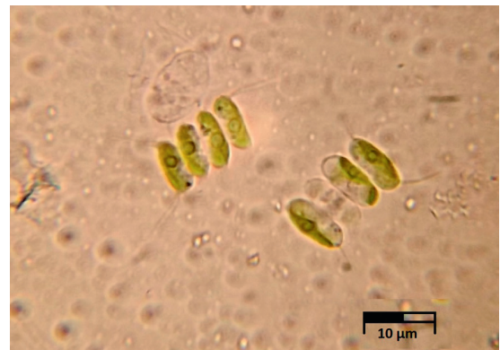
Figura 1. Fotografía microscópica (1000X) de la microalga Scenedesmus sp.

Para poder estimar la biomasa microalgal a partir de los valores de densidad óptica, se realizaron diluciones de un cultivo concentrado de Scenedesmus que permitiera obtener diferentes concentraciones de la microalga. De cada una de las diluciones se tomó la densidad óptica (660 nm) y el peso seco. Para este último se filtró un volumen de 100 ml de cada una de las diluciones sobre filtros de celulosa, previamente pesados, y se pusieron a secar en un