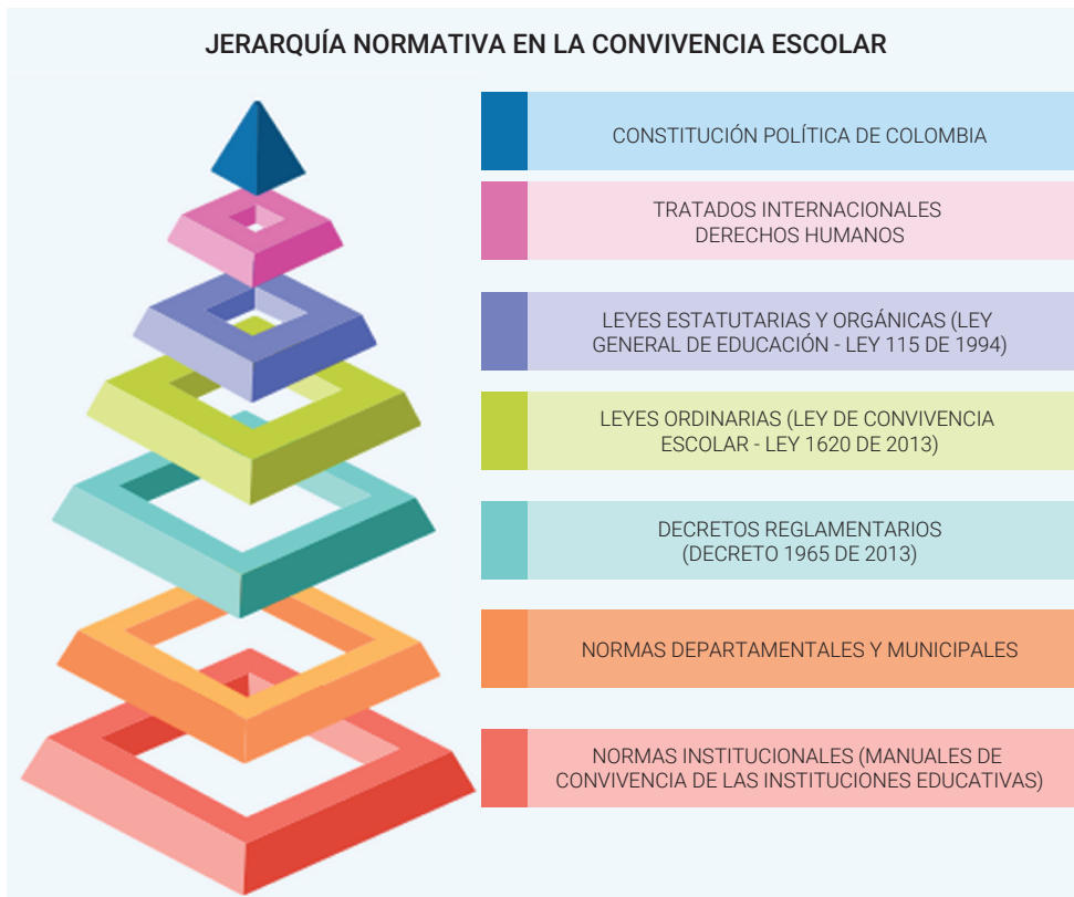
Figura 2. Jerarquía normativa en la convivencia escolar Nota: Elaboración propia con base en la Jerarquía normativa (Hans Kelsen)

La jerarquía implica que la Ley de Convivencia Escolar (Ley 1620 de 2013) está por encima de las normas municipales y de las normas institucionales de los colegios, trayendo consigo que los Comités Municipales de Convivencia Escolar (CMCE) y las instituciones educativas deben alinear sus políticas y procedimientos con esta ley, asegurando que sus normativas internas no sean contrarias con lo establecido en la legislación nacional (Peña-Figueroa et al., 2017).