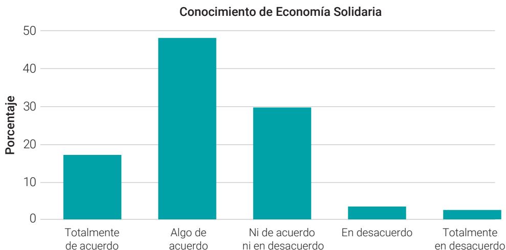
Figura 3. Número personas que identifican los principios, fundamentos e iniciativas de la Economía Solidaria

Nota. la figura muestra la cantidad de sujetos que identifican los principios, fundamentos e iniciativas de la economía solidaria.