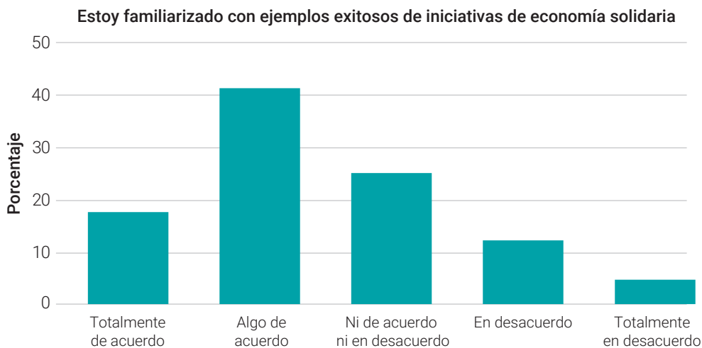
Figura 5. Número de encuestados que identifican éxitos de iniciativas de la economía solidaria.

La tabla 7 y la figura 5 reflejan los resultados de la investigación que evalúa el nivel de familiaridad de los encuestados con ejemplos exitosos de iniciativas de economía solidaria. Los resultados se distribuyen en cinco categorías de respuesta que van desde “Totalmente de acuerdo” hasta “Totalmente en desacuerdo”, y cada categoría indica el número de encuestados (frecuencia), el porcentaje correspondiente y el porcentaje acumulado.