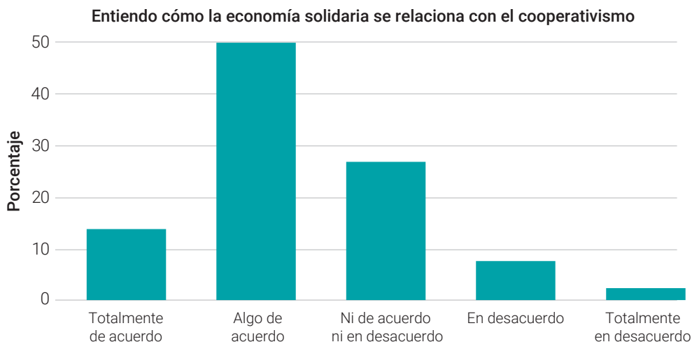
Figura 4. Identificación de personas en la relación de la economía solidaria y el cooperativismo.

Nota. Relación entre economía solidaria y el cooperativismo.